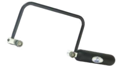
Arco de sierra Antilope Extra