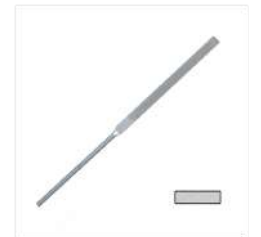
Limatón plano 18 cm

Comprueba siempre el grosor de la pieza, antes de limar.