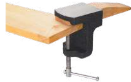
Astillero para bancos con tas