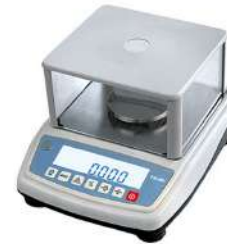
Balanzas NHB-NHB-1500/0,02 GR.GR