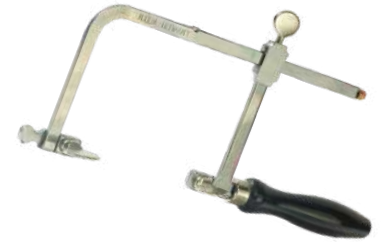
Arco de sierra Antilope 80 mm

Para que el corte sea suave sobre el metal lubrique constantemente la segueta con cera de vela.