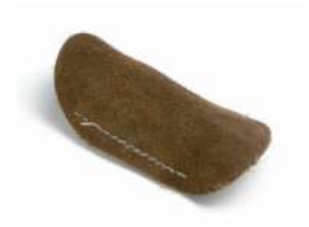
Dediles protectores de cuero lu

No es lo mismo una pasta para quitar imperfecciones, que una pasta para dar brillo a una superficie lisa.