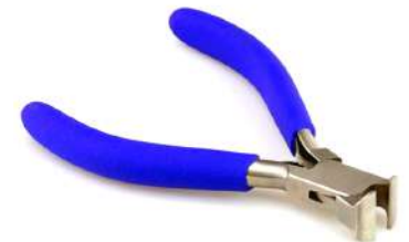
Alicate corte frontal 130 mm