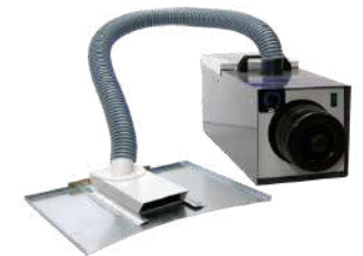
Aspirador compact + 2m tubo

Cuando estés trabajando en la mesa de joyero, ten abierto el cajón principal para que el metal o cualquier piedra o material no se te pierda.