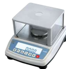
Balanza sky 1500 gr/0,05 gr