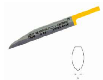
Buril ongette corto hss Vallorse

El Buril utilízalo para texturizar, hacer adornos decorativos, eliminar rebabas y, en menor medida, colocar piedras.