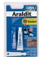
Araldit estándar blister 5+5 gr

Cuando termines con el dado de embutir, acuérdate de la limpieza, tendrás que engrasarlo y dejarlo dentro de una bolsa hermética. Con ello evitarás que se oxide.