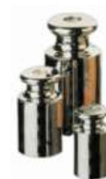
Pesas calibración m1 2000/0.01gr

Al pesar ten cuidado con el aire circundante, te podrá variar en gran medida el pesaje.