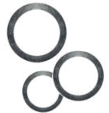
Junta grafito 100

Utiliza siempre un cilindro de grafito de capacidad superior al metal que pretendas fundir.