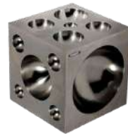
Dado de embutir 63x63 mm estándar