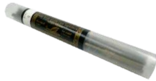
Gruesa pelos caracol