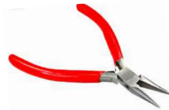
Alicate 1/2 caña 130 mm Antilope