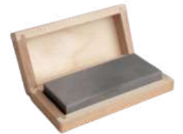
Piedra de toque natural con caja de madera