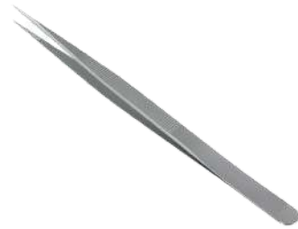
Pinza de joyero 16,5 cromada