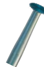
Fresa sierra fig 45 - Maillefer