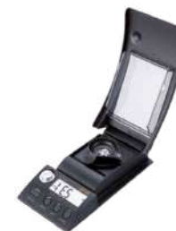
Quilatero Tanita 1230 100 ct