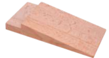
Astilleras normales 172x63 mm