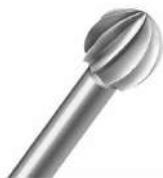
Fresa bola c.t - Maillefer