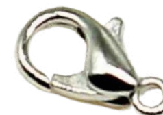
Mosquetones (desde 8 hasta 18mm)