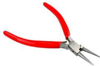
Alicate redondo 130 mm Antilope