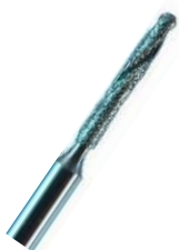
Fresa broca diam - Antilope