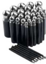
Embutidores Standar set 14 pcs