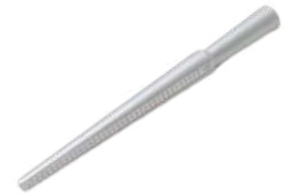
Palo medidas 4 escalas Antilope