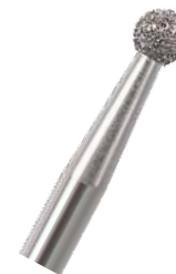
Fresa bola diam - Edenta

Deja que la herramienta haga el trabajo y no presiones innecesariamente, no uses una velocidad o presión excesiva para forzar una fresa.