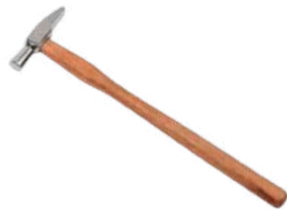
Martillo relojero 60/70 mm Antilope