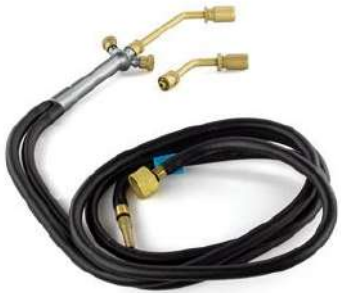
Soplete Orca + Mang Hom

Antes de empezar, te recomendamos varios productos indispensables para que tu taller esté al día.