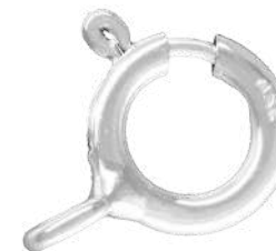
Reasas (desde 5 hasta 8mm)