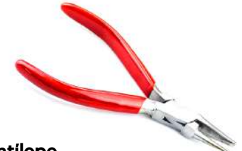
Alicate plano - redondo 130 mm Antilope