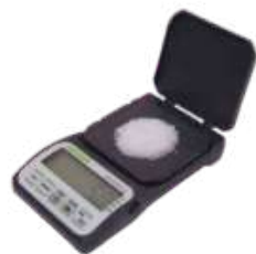
Balanza jadever jkd 250/0.05gr