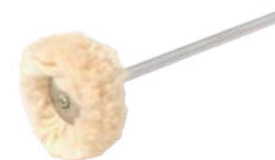
Borrego Montado 21 mm Antilope