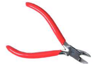
Alicate corte lateral 115 mm Antilope

Los alicates de punta plana presentan un conjunto de mandíbulas mucho más amplio y tienen una superficie plana, lo que los hace útiles para crear curvas y ángulos agudos en la chapa metálica.