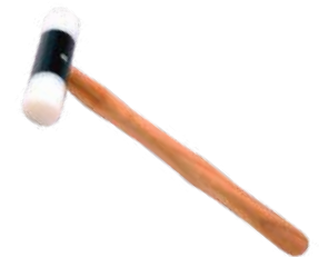
Maza de nylon 25mm

Disponemos de martillos con cabezal extraíble para hacer textura. No confundas con el martillo plano de trabajo.