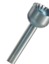
Fresa cóncava fig sf- Maillefer