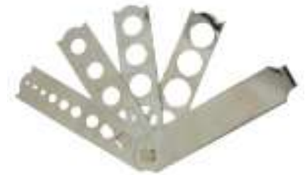
Galga 7 brazos tallas import