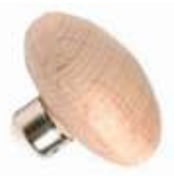
Mango buril G - Lenteja peq