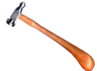
Martillo cincelar 25 mm Antilope