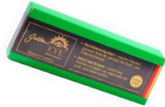
Gruesa de pelos Goldeneye