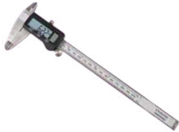
Calibre pie de rey digital 150 mm