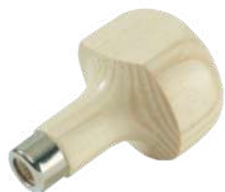
Mango de madera para granetes