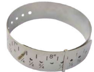
Medidor de pulseras