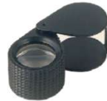
Lupa 10X RED.C/Goma import