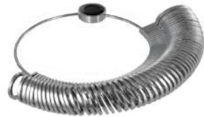
Anillero 1-36 Antilope