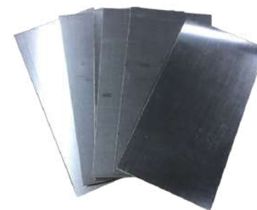
Plancha de plata

Cada cadena es única, elige bien el mosquetón o la reasa para que te encaje bien.