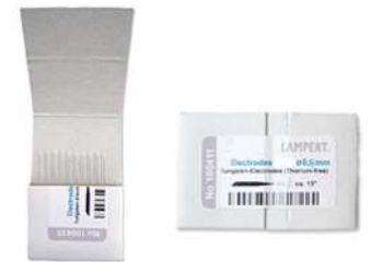
Electrodos Inostar 0,5mm ecopack

Mantén siempre limpias las piezas a soldar, la soldadura no fluirá y las piezas no se unirán si alguna parte de la ecuación está sucia.