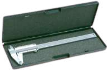
Calibre pie de acero 150 mm