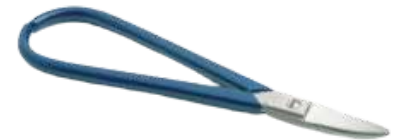
Tijera plancha fina 17 cm recta