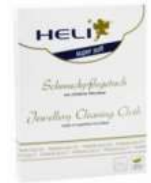
Gamuza joyas 30x24 cm heli

Recuerda que un astillero tiene dos posiciones: Una es la rampa de frente (la más usada), y la otra es la superficie lisa frontal. Dale la vuelta al astillero para conseguir alguna de las dos.