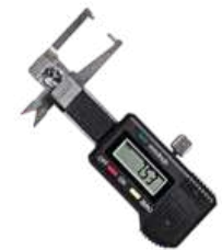
Calibre pocket digital