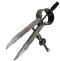
Compás puntas acero templado 100 mm