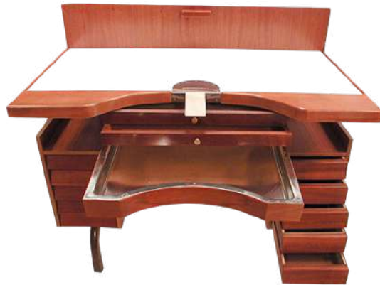
Mesa joyero extra