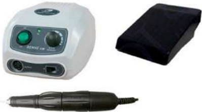
Micromotor Renhe 119 con acelerador