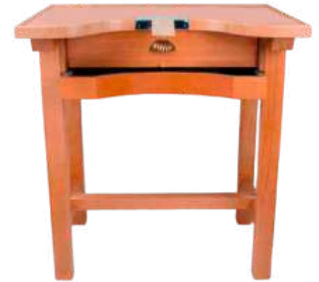
Mesa joyero 1 puesto eco