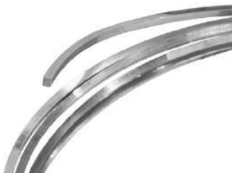
Hilo de plata (cuadrado y redondo)