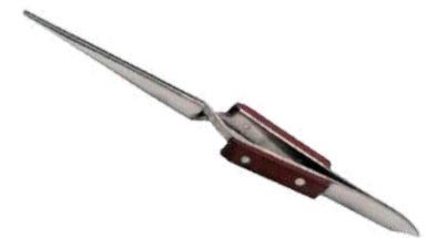
Pinza cruzada recta 16,5 cm