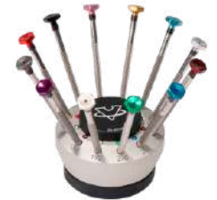
Juego 9 destorn+soport 0.6-3.0mm