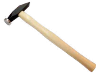
Martillo Joyero Antilope