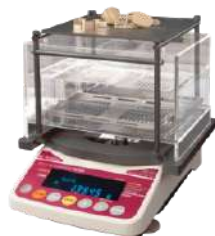
Balanza de densidad goldtester gks-3000