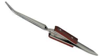
Pinza cruzada curva 16,5 cm