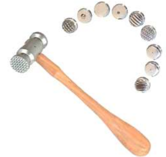
Martillo con texturas con 8 caras