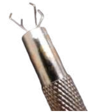
Pinza 3 garra pequ. MR.GEMS

Elige correctamente la pinza para el trabajo. No es lo mismo una pinza para sujeción de diamante que una para recibir fuego.